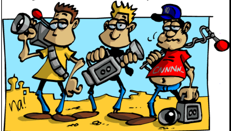
Comme en 1991, la guerre sera aussi une guerre médiatique